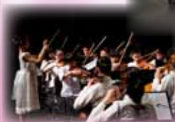
何文耀指揮管樂團演出