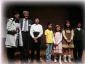
著名國際小提琴家張世祥教授在11月21日的大師班後與小團員合照