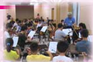
著名指揮家呂晚一訓練弦樂團